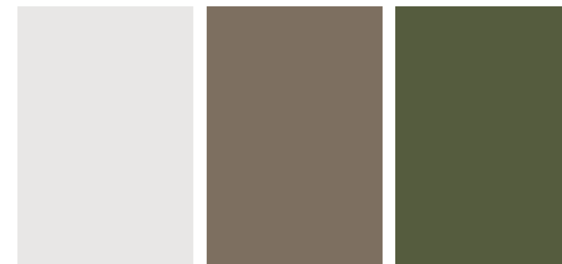
Ghiaccio Ice White - Glacier