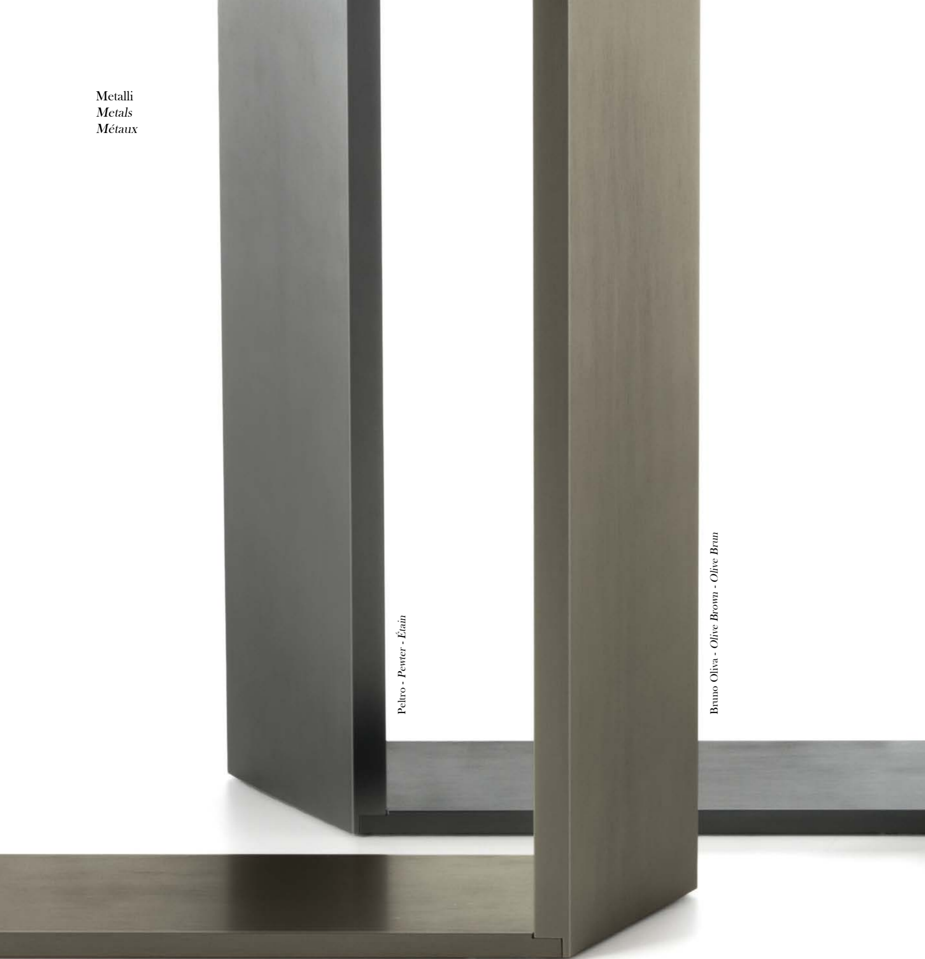
Peltro - Pewter - Étain