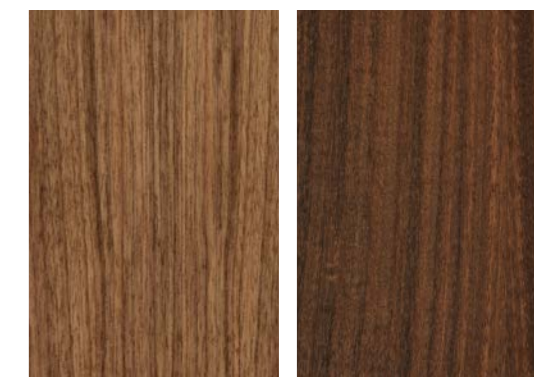
Noce Walnut - Noyer